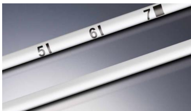
Markers di lunghezza numerici