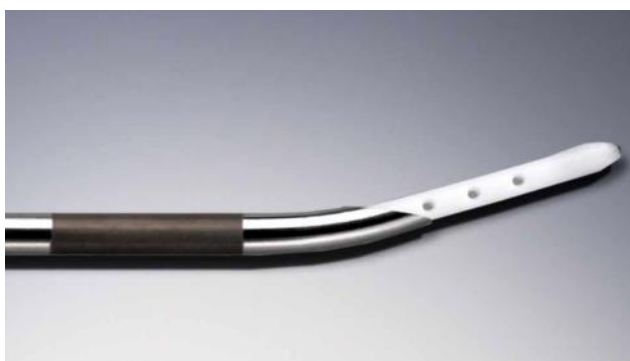
Le tacche di lunghezza del catetere allineati alla cannula Tuohy