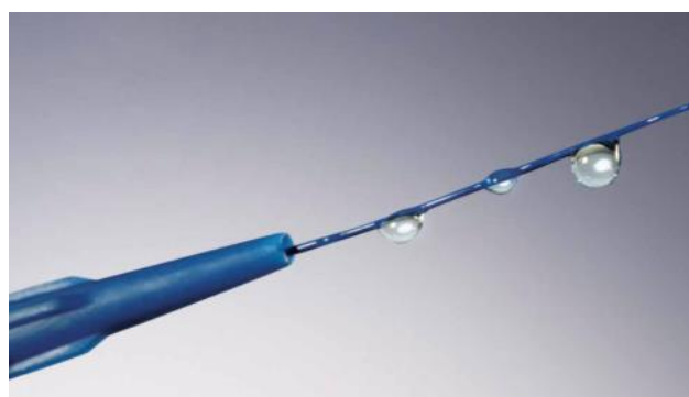
Rivestimento idrofilo del filo guida evita il rischio di dislocazione del catetere dopo il suo posizionamento