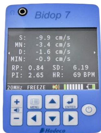
Schermata dati numerici