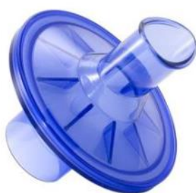
Filtro anti batterico virale compatibile con tutti gli spirometri Vitalograph