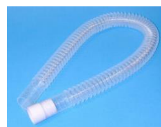
Tubo corrugato per spirometri Vitalograph modello 2150 e 2160