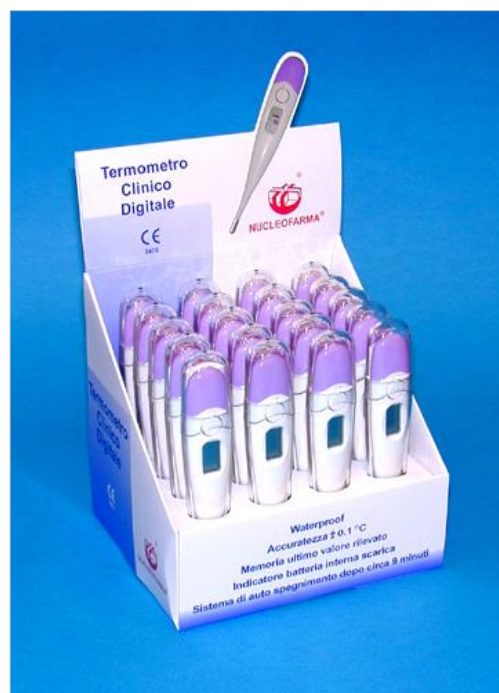
Espositore da 20 pz.