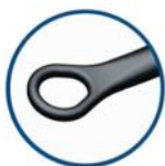
Jobson Round Larghezza 3 mm