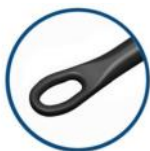
Jobson Oval Larghezza 2,5 mm