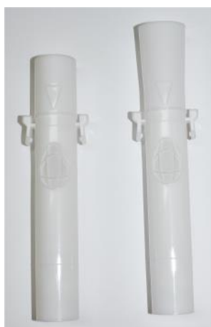
Spirotube retto e a morso (riutilizzabili)