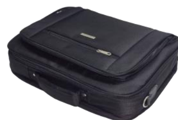
Borsa per il trasporto