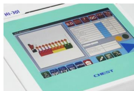
Incentivazione animata per i bambini