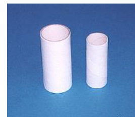
Bocchagli monouso compatibili con tutti gli spirometri Vitalograph