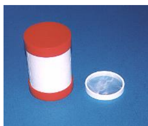
Filtri per spirometro Compact

Box da 10 cartucce Cod. 28.026 (disponibilità fino ad esaurimento scorte)