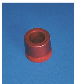
Adattatore per bocchaglio pediatrico compatibile con tutti gli spirometri Vitalograph