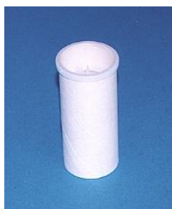
Bocchagli di sicurezza compatibili con tutti gli spirometri Vitalograph