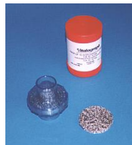
Filtro condensa per spirometri Vitalograph 2150 e 2160

Box da 10 cartucce Cod. 28.026 (disponibilità fino ad esaurimento scorte)