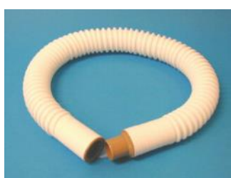
Tubo corrugato sterilizzabile per spirometri Vitalograph modello 20.600 Clinico "S" e 20.640 Professionale "R"