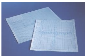
Schede per spirometri Vitalograph modello 2150 e 2160