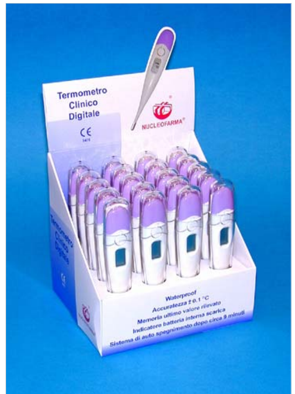
Espositore da 20pz